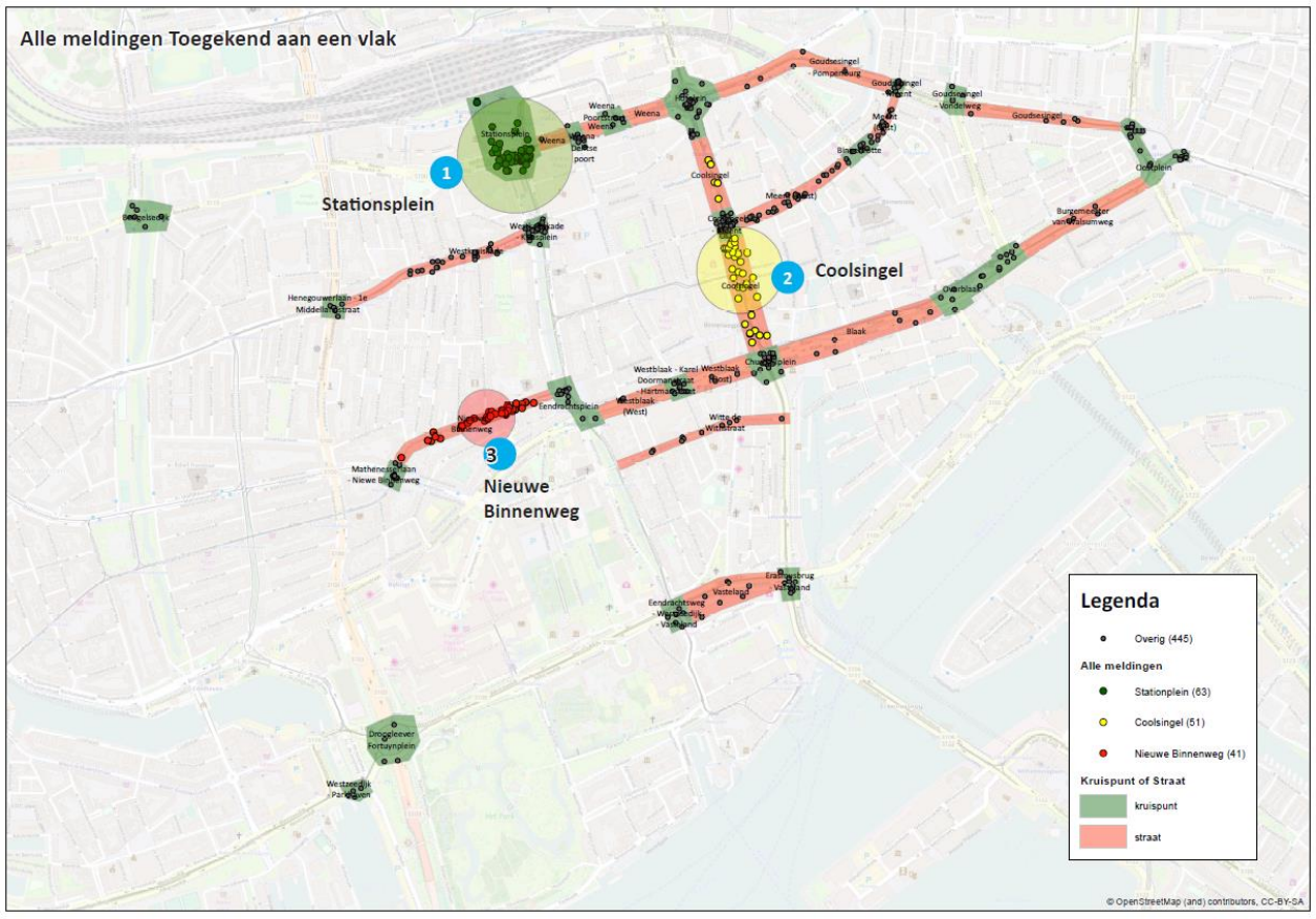
Figuur 2 overzichtskaart prikkers verkeersonveilige locaties volgens respondenten